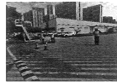
12、应急小组Bさ检查周边雨水井及1号雨水隔油池有无油迹, 并向工长汇报