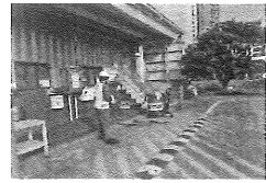
1、作业员AさATF油加油作业.