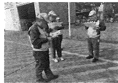
13、部长、科长、ISO事务局、技术员到达现场了解情况