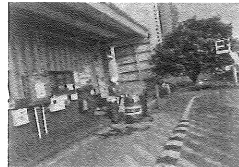
5、作业员Aさ向工长报告：“ATF油油管破损, 发生了泄漏”