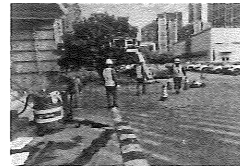
11、应急小组Cさ围蔽周边区域, 防止无关人员接近