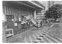
2、加油管破损泄漏, ATF油溅到地面.