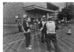
14、部长、科长、系长、ISO事务局、及相关人员商议对策