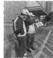
7、系长指示工长：“带领应急小组赶往现场进行紧急处理。”