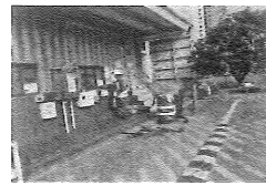
3、作业员Aさ立即关闭加油设备及阀门,