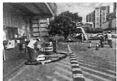
15、应急小组清理现场泄漏的废油, 并将产生的危废：废水、废油、废抹布等废弃至指定位置