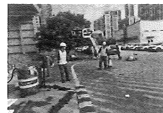
10、应急小组Bさ协助Aさ对漏油部位及周边进行封堵