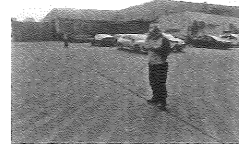
6、工长向系长报告：“ATF油加油时, 油管破损, 发生了泄漏, 请求紧急处理”