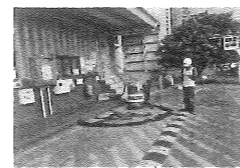
4、使用环境应急备品进行围蔽及阀门,